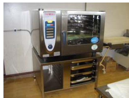
コンベクションオープン

また、平成24年度事業として、赤い羽根共同募金会より車両購入資金補助が決定し、6月11日に日産セレナが納車されました。