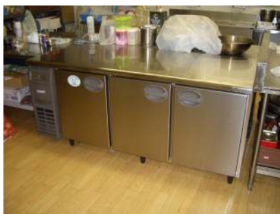
クールドテーブル