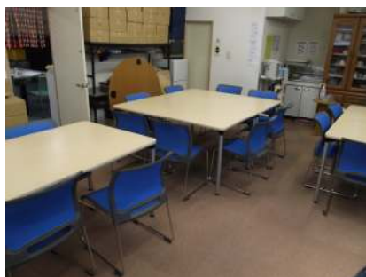
作業テーブル・イス