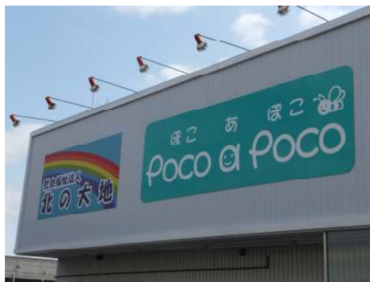
（北見市柏陽町 「捏」様と同じ建物）